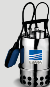
BEST ONE VOX

Curvas publicadas e critérios de aceitação conforme Norma ISO 9906 anexo A